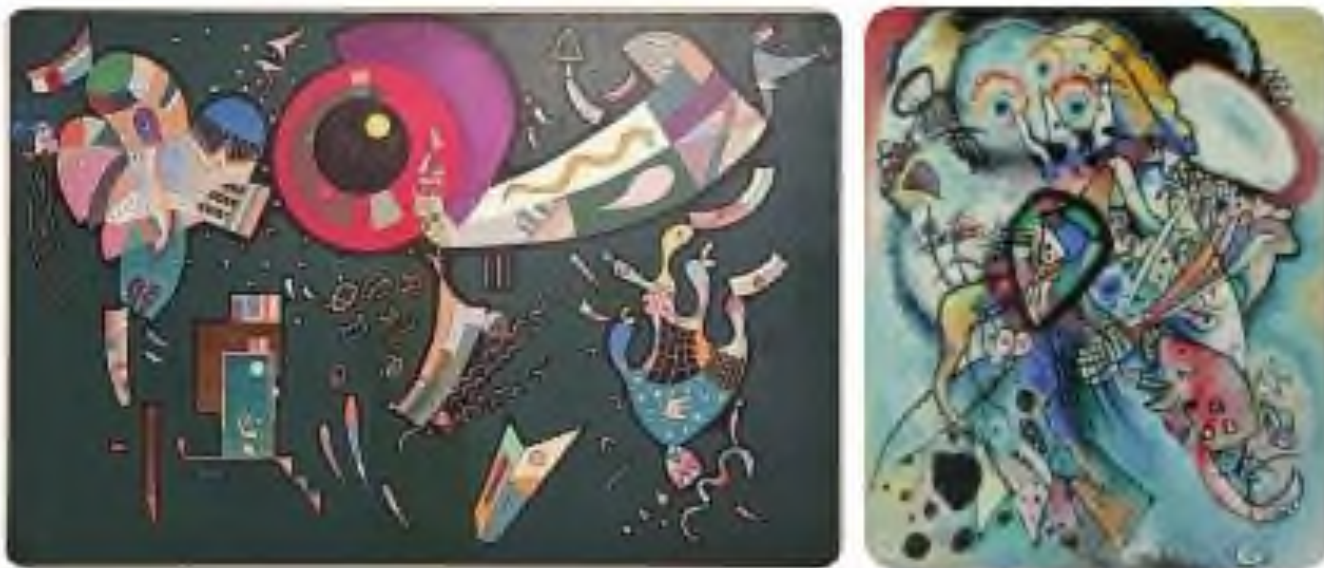
Рисунок 4 - Примеры творческой манеры Кандинского

4. Подготовьте краткий доклад (3–4 минуты):