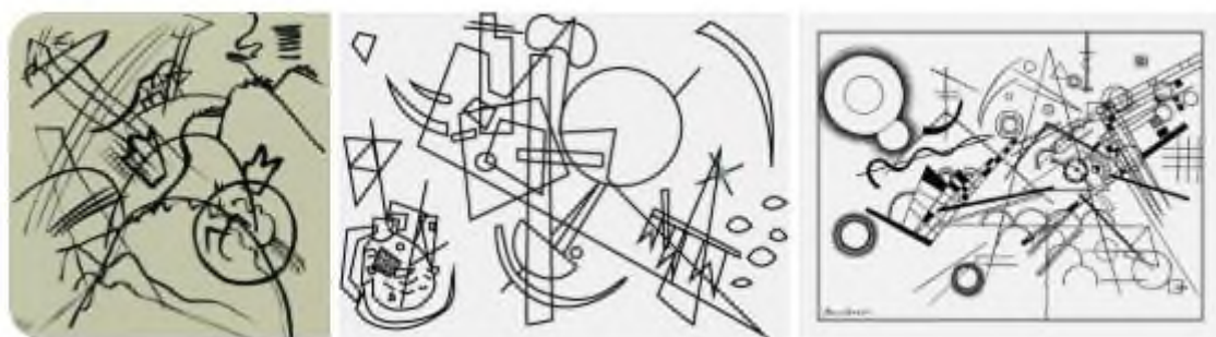
Рисунок 2 - Примеры эскизов по мотивам В. Кандинского

Практическое занятие № 4. Творчество К. Малевича. Копия работ. Разработка серии эскизов по мотивам К. Малевича