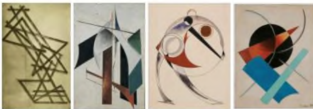
Рисунок 3 - Примеры работ Родченко

2. Выберите 2 работы Родченко для копирования (желательно из разных направлений — например, живописная композиция и плакат).